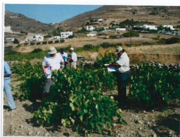
ΕΙΚΟΝΑ 2. Διαδικασία επισήμανσης «πλεονεκτικών» πρέμνων σε αυτόριζους αμπελώνες της Πάρου.