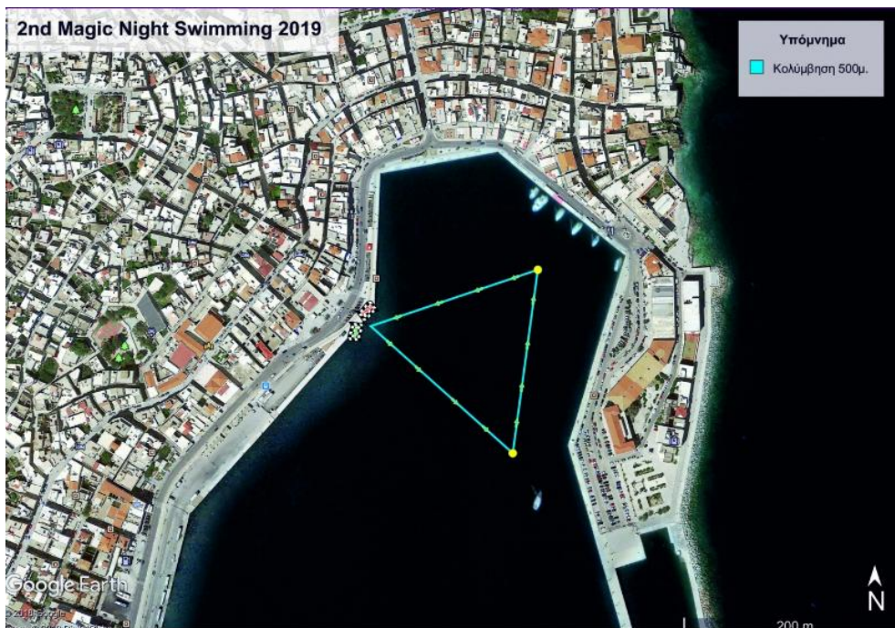
(ΛΙΜΕΝΑΣ ΕΡΜΟΥΠΟΛΗΣ ΣΥΡΟΥ- 13/09/2019)